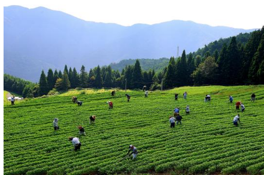
「天空の土寄せ」 三好英運