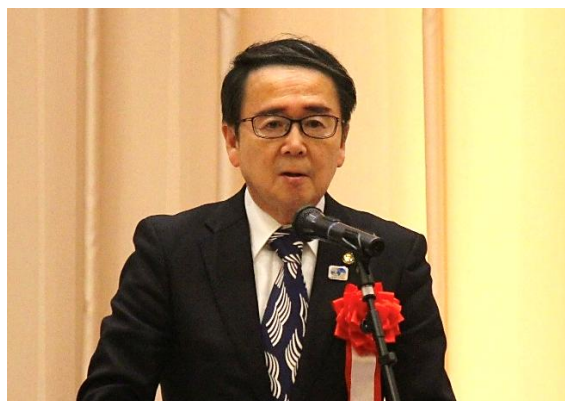
池田県知事よる祝辞

さらに、昨年4月に策定された食料・農業・農村基本計画では、「農業構造転換集中対策期間」として令和11年度までの5年間で約8,000億円の別枠予算が確保されおり、農地の大区画化や中山間地域のきめ細かな整備などが推進されていることを紹介した。