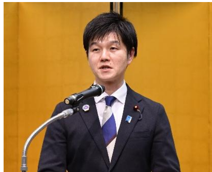
鈴木憲和 農林水産大臣による祝辞