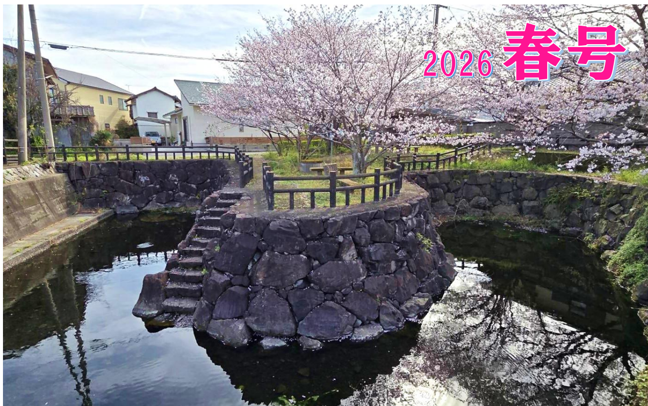
「二頭出水」(善通寺市生野町)