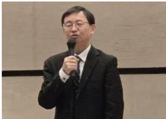
青山健治農林水産省農村振興局次長の挨拶

続いて、萩尾俊宏農林水産省農村振興局整備部設計課課長補佐から、令和8年度当初予算概算決定の概要について説明が行われた。農業農村整備事業関係予算は、対前年度比40億円増の4,504億円となり令和7年度補正予算2,439億円を合わせた総額は6,942億円となる。また、令和7年4月11日に閣議決定された「食料・農業・農村基本計画」における農業農村整備の主な位置付けや、地方財政措置、大区画化等加速化支援事業などの令和8年度の新規・拡充事業についても説明があった。