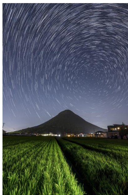
「処暑の候星纏う飯野山」高崎彰