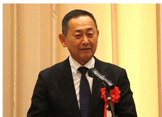
谷久県議会議長よる祝辞