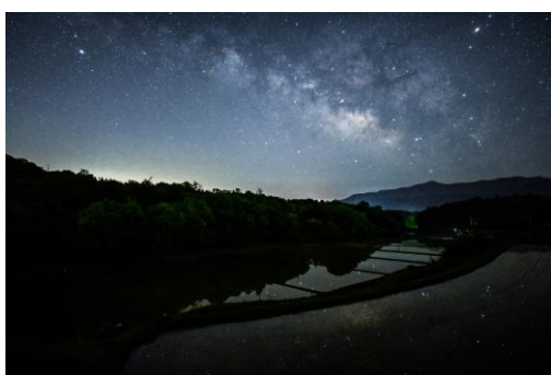
「星を湛えて」 高橋弘