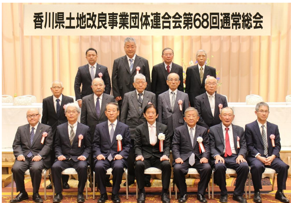
香川県職員表彰者名簿