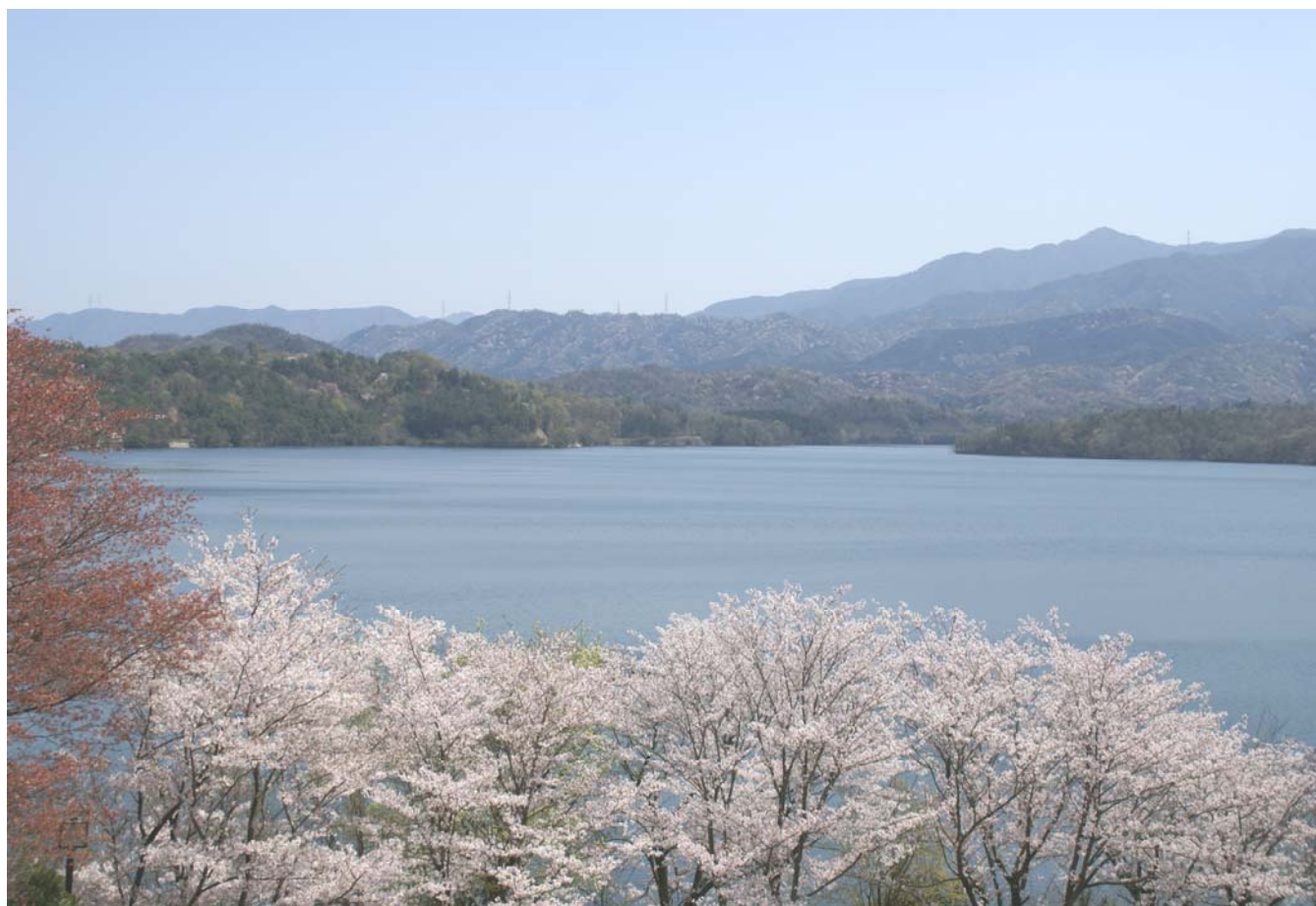
「ため池百選」に選定された満濃池（仲多度郡まんのう町）