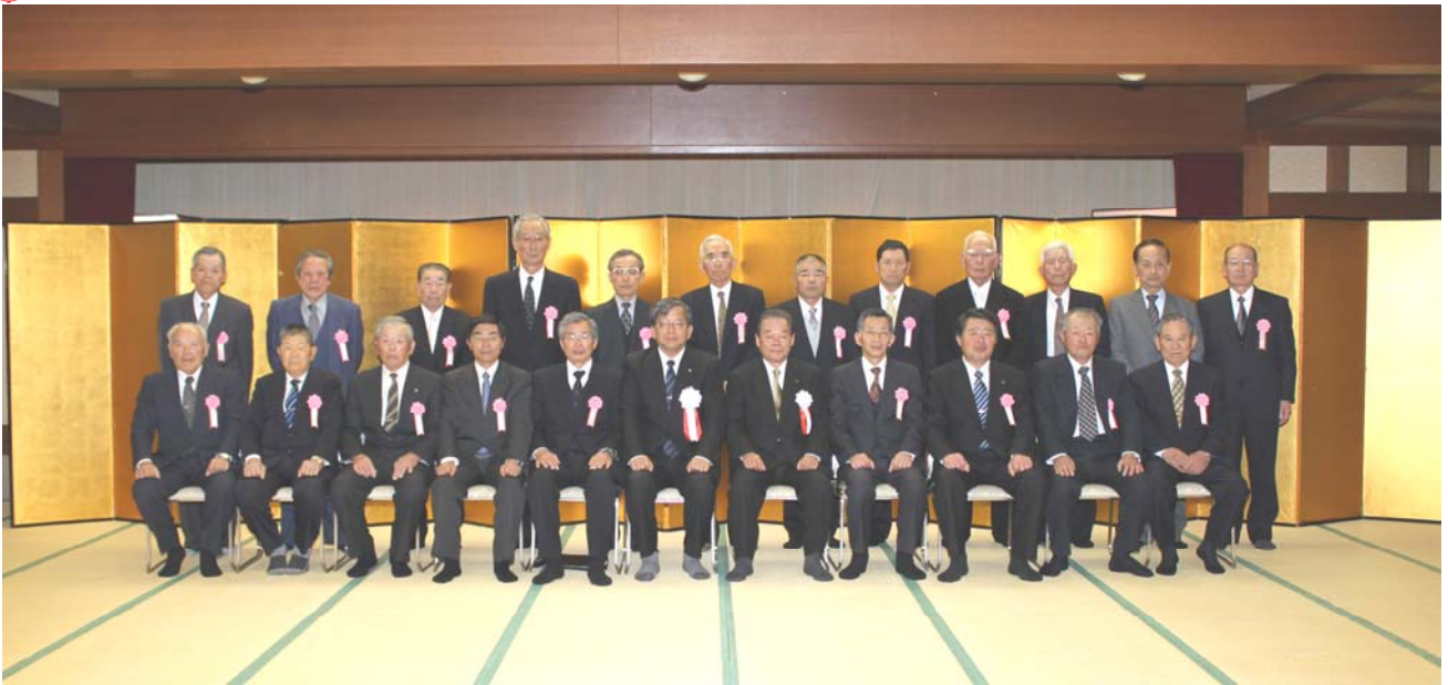
香川県職員表彰者名簿