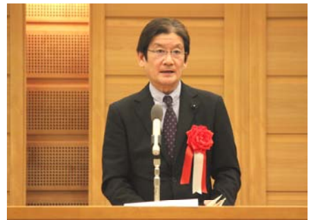
宮本県議会副議長