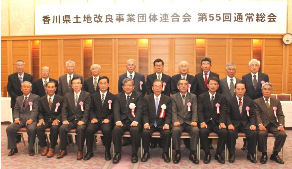
香川県職員表彰者名簿